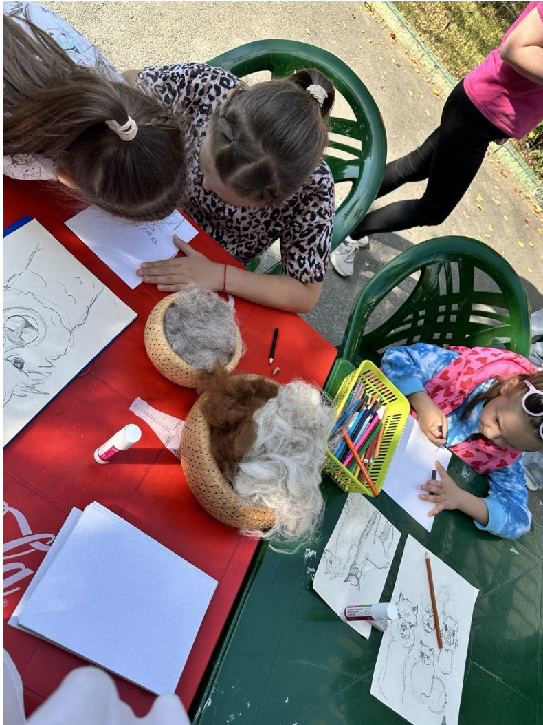
Мастер класс: рисование альпак